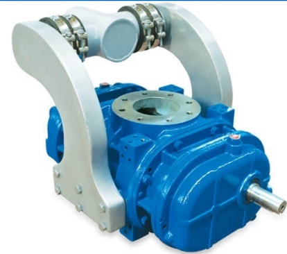
Qs (m 3 /h) (La /Kw)